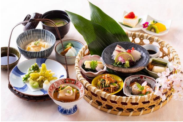
※「奏(かなで)」のイメージ写真

【ご予約・お問い合わせ】 日本料理 折鶴 TEL 097-533-5491(直通)