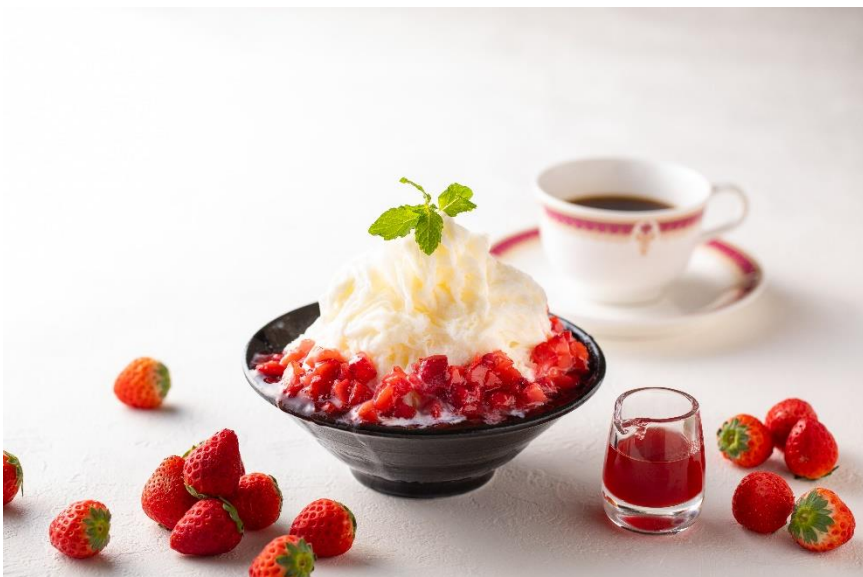
※苺のミルクかき氷 イメージ写真

2階「日本料理 折鶴」からは、春の訪れを一足先に祝う「苺のミルクかき氷」。ふわふわで口に入れるとすうっとなくなる甘いミルクかき氷。苺の甘酸っぱさとのバランスをお楽しみいただけます。季節の食材をふんだんに詰め込んだランチ「奏(かなで)」3,500円を召し上がった後のデザートにも、おすすめでございます。