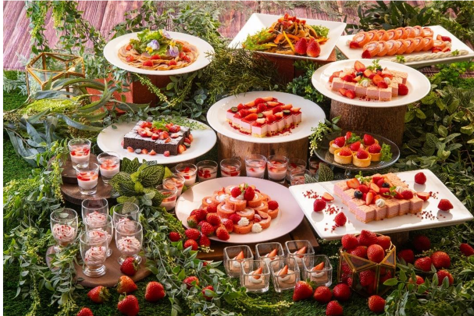
2階オールデイダイニング セリーナ「ストロベリーランチブッフェ」イメージ写真

皆様に愛される苺、今年は弊ホテルのレストラン 3店舗にて苺をメインとした企画を同時開催させていただきます。 本フェアでは可愛い苺の様々なスイーツを是非お楽しみ下さい。